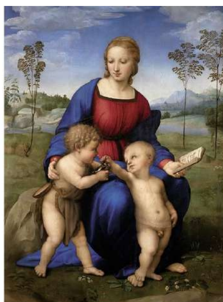
RAFFAELLO SANZIO MADONNA DEL CARDELLINO

NEL TRE-QUATTROCENTO HANNO UN RUOLO IMPORTANTE ANCHE LE CORPORAZIONI: TRA QUESTE L'ARTE DEL CAMBIO E QUELLA DELLA MERCANZIA CHE RICHIEDONO A PIERO POLLAIUOLO E A BOTTICELLI UNA SERIE DI VIRTU':