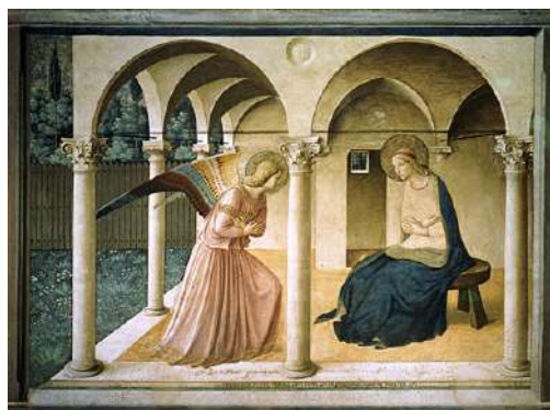
BEATO ANGELICO ANNUNCIAZIONE

MOLTEALTRE OPERE ORA IN GALLERIA SI DEVONO INFINE ALLA COMMITTENZA DI CHIESE, CONFRATERNITE E CONVENTI DI FIRENZE E DINTORNI, DOVE PURE SI FORMANO ARTISTI MONACI COME BEATO ANGELICO