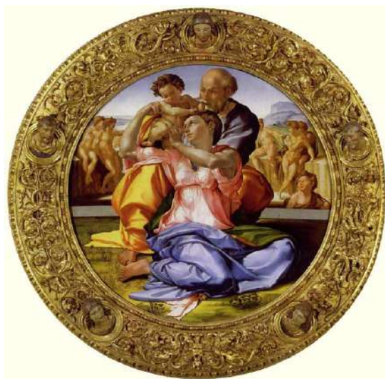
MICHELANGELO BUONARROTI TONDO DONI

NEL CINQUECENTO AGNOLO DONI FU COMMITTENTE DI MICHELANGELO E RAFFAELLO