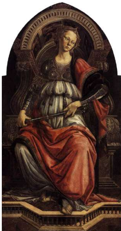
BOTTICELLI LA FORTEZZA