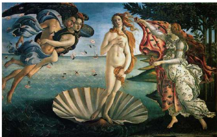
BOTTICELLI NASCITA DI VENERE

(PERCHE' AGLI UFFIZI DI BOTTICELLI C'E' QUESTO ED ALTRO...)