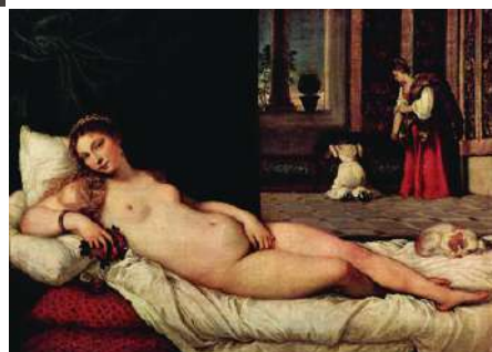
VENERE DI URBINO TIZIANO