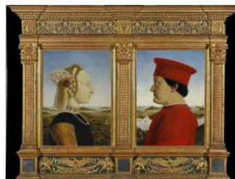
DITTICO DI PIERO DELLA FRANCESCA