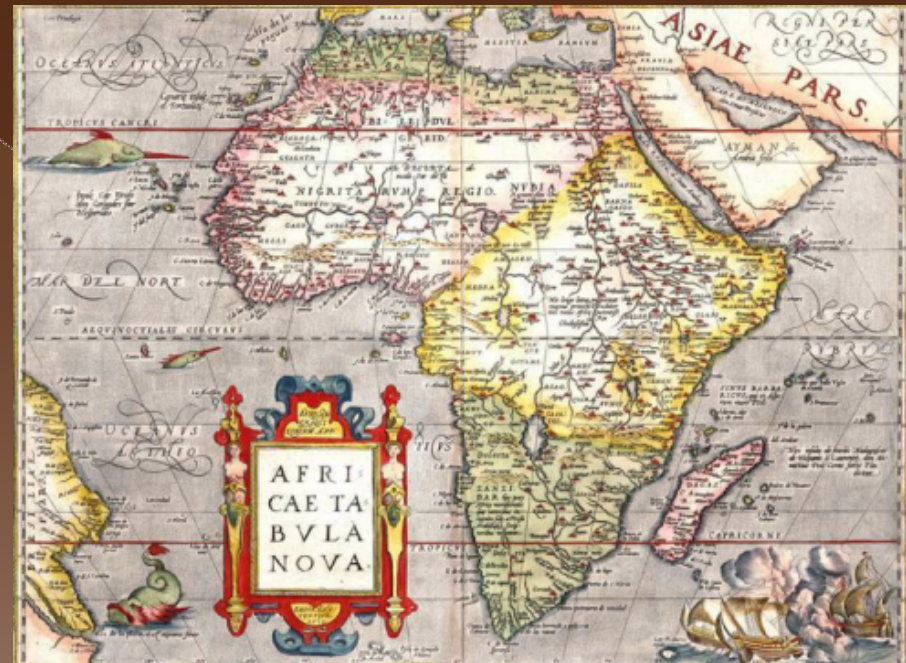
Mappa del 1570