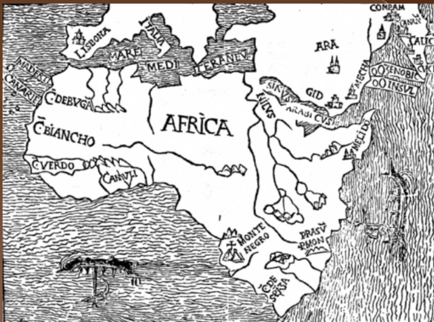
Mappa del 1508