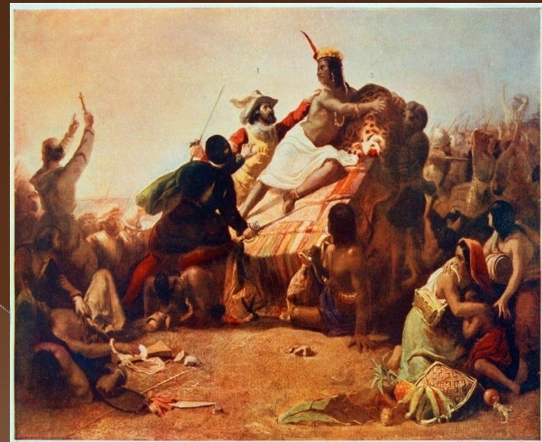
On the 16th November, 1532, Pizarro, after ambushing the great square in the town of Cajamarca with artillery and soldiers, held an interview with the Inca, Atahualpa, who was accompanied by five thousand men only partially armed. Atahualpa was commanded to embrace the Christian faith, which was briefly explained to him, to give up the administration of his kingdom and to pay tribute to Charles V. The Inca returned a very respectful answer at first, but then began an impassioned speech exposing the designs and cruelties of the Spaniards. Pizarro gave the signal for assault, and the Peruvians, who were completely unarmed, were cut down in hundreds. The Inca was seized, imprisoned, and afterwards put to death.